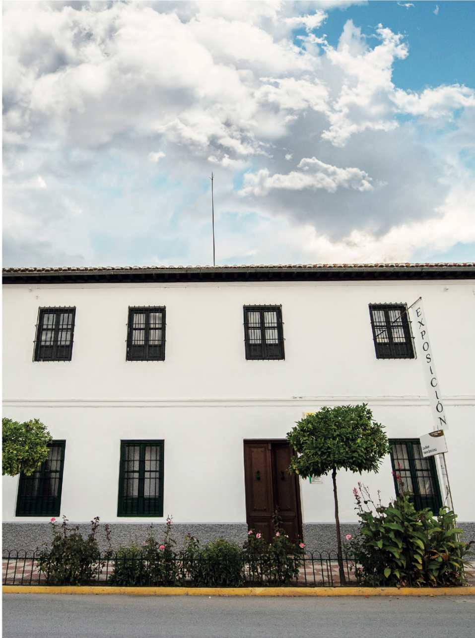
Casa Museo Federico García Lorca de Valderrubio